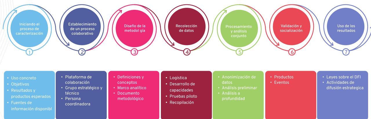
Figura 2: Fases clave de un proceso colaborativo de caracterización para analizar una situación de desplazamiento.

Un ejercicio de caracterización es valioso sobre todo por el proceso que conlleva: realizado de manera correcta, puede contribuir a superar varios de los retos mencionados como el de la falta de armonización de conceptos, los problemas de coordinación entre diferentes organizaciones, y también las tensiones que pueden generarse por no considerar la totalidad de las comunidades afectadas por el desplazamiento. En esta sección se presentan los elementos mínimos que deben ser abordados en cada una de las fases de un ejercicio de caracterización para garantizar que el proceso alcance su potencial (ver figura 2) 27 .